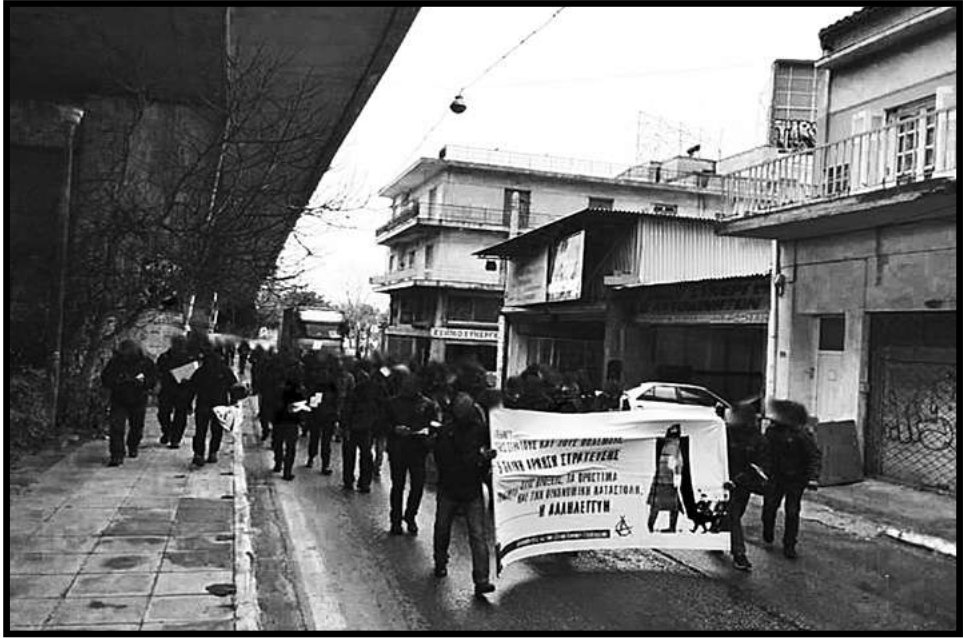
Φωτογραφίες από τις συγκεντρώσεις αλληλεγγύης στους 3 διωκόμενους ολικούς αρνητές στράτευσης στο στρατοδικείο του Ρουφ στις 6 και 18 Φλεβάρη 2019