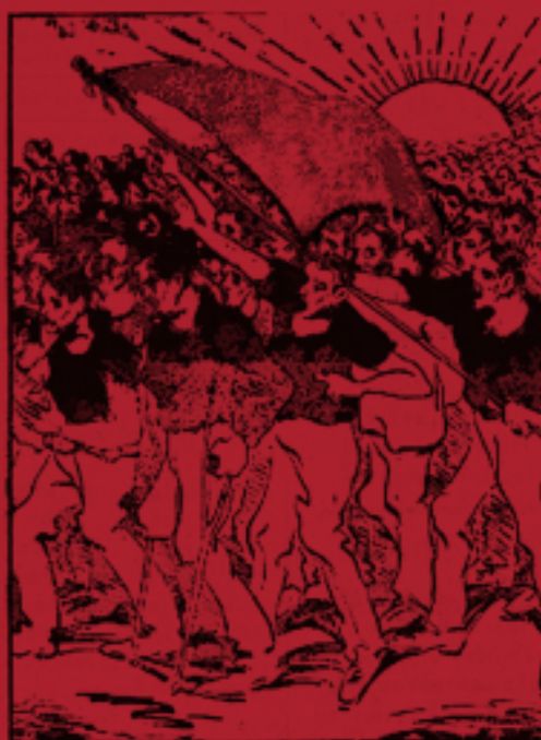
ΕΜΠΡΟΣ ΤΗΣ ΓΗΣ ΟΙ ΚΟΛΑΣΜΕΝΟΙ...

Σάββατο 24 Φλεβάρη ώρα 20.00 στο χώρο της κατάληψης