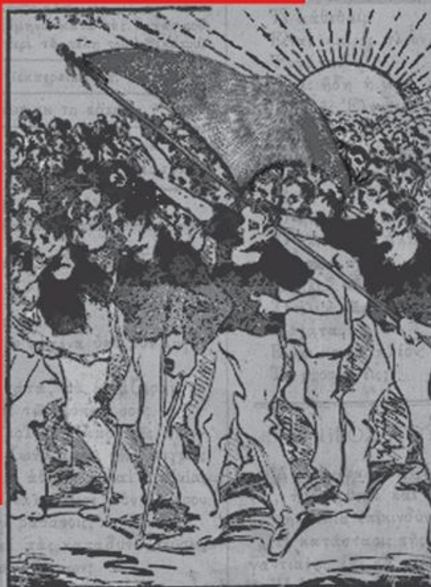
ΕΜΠΡΟΣ ΤΗΣ ΓΗΣ ΟΙ ΚΟΛΑΣΜΕΝΟΙ...

Ο ήλιος της Αναρχίας ανέτειλε Για μια ιστορία του αναρχικού κινήματος του «ελλαδικού» χώρου