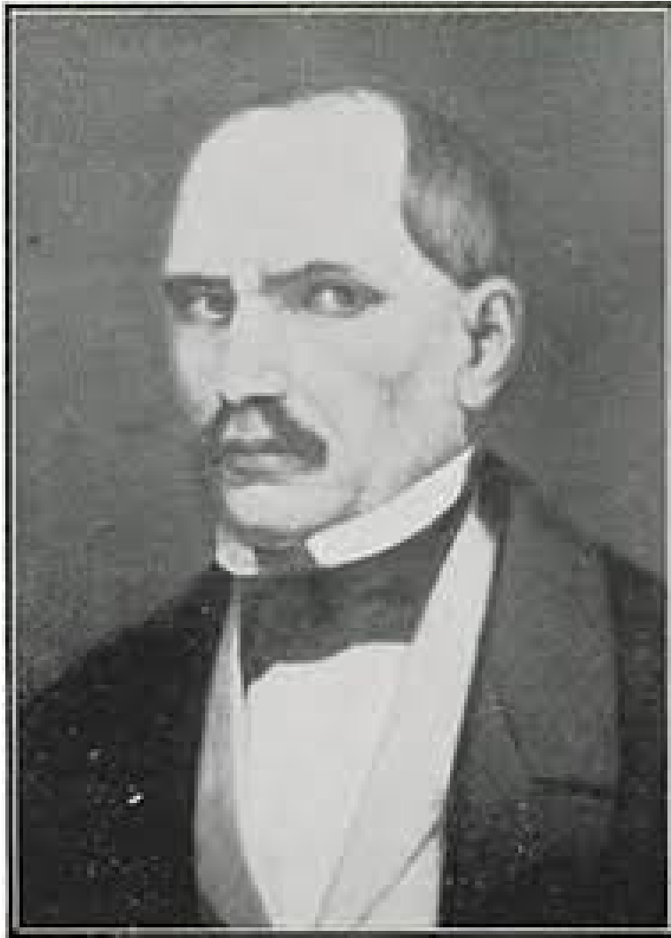
Ο Φραγκίσκος Πυλαρινός

στενά όρια των εθνών και των κρατών και να πάρει παγκόσμια μορφή. Μετά από νέες διώξεις σε βάρος του, το 1839 εγκαταστάθηκε στην Αθήνα. Πέθανε το 1882.