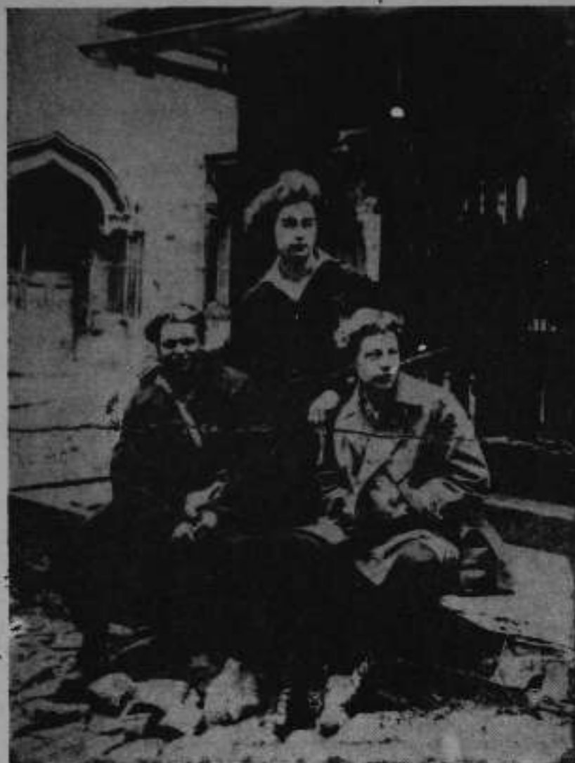
Νεαροί αναρχικοί από την Κολωνία (CHEMNITZ, 1930)

τος. Πρέπει από μόνι-μας να επεμ- βούμε.