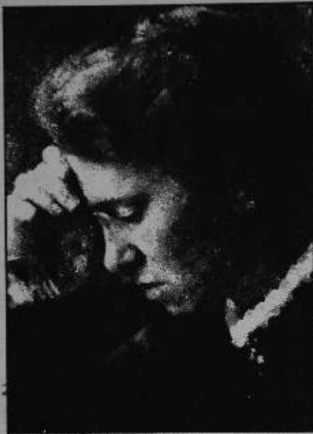
Η Έμμα Γκόλντμαν πέν έτος μετά την εκπαράττεισή της