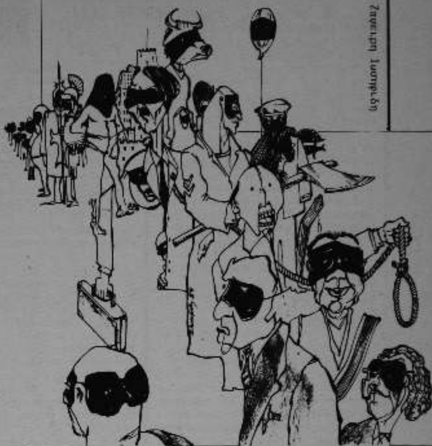
Σχέδιο Ζησεφινι Ιουστρεβι

Οι καιροι οπου τα κεφάλια επείρταν ρυθμικα στο πανερι μοιάζουν μακρινοι. Μυθικοί. Κι' ο πελεκυς αγνώστος ή καλύτερα, εκλεπτισμενα παραγκωνισόμενος απο τις υπερουγχρονες διαδικασίες θανατώσης. Η εσχάτη των ποιων με τις ευλογίες της δικαιοσύνης ή καλύτερα το