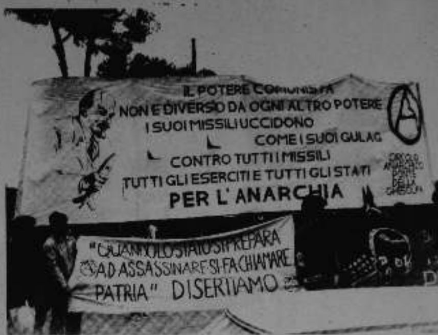
Στο μεγάλο πάνω: "Η κομμουνιστική εξουσία δεν είναι διαφορετική από κάθε άλλη εξουσία. Οι πυραύλοι-της σκοτώνουν όπως και τα γκουλάγκ-της. Ενάντια σ' όλους τους πυραύλους, όλους τους στρατούς κι όλα τα κράτη. Για την Αναρχία". Στο μικρό πάνω: "Όταν το κράτος ετοιμάζεται να δολοφονηθεί, επικαλείται την πατρίδα. Ας λιποτακτούμε".

Ένας νέος ρεαλισμός προτείνεται. Είναι ο ρεαλισμός της Ουτοπίας. Γι' αυτό ο παλιός πολιτικός ρεαλισμός που θέλει να κινείται στο εσωτερικό των εν λειτουργία μηχανισμών, έχει δείξει αληθινά την ανικανότητα να τροποποιήσει την κατάσταση των πραγμάτων όπως έχουν σήμερα. Το πραγματικό-του πρόσωπο γίνεται ορατό και πιο καθαρό: Είναι το πρόσωπο της συνειδητής-συνεργείας. Η εμπειρία έδειξε εκ των πραγμάτων, ότι ο θεσμικός ρεαλισμός (μεταρρυθμίσεις) απέτυχε οκτώ φορές. Η πρόταση του Αντρέα Κοστά, "να μπου με στο κοινοβούλιο για να το καταστρέψουμε", μετά από έναν αιώνα κοινοβουλευτικών περιπέτειών, έδειξε την ολοκληρωτική της αποτυχία, γιατί το κοινοβούλιο κατέστρεψε την παλιά πρόταση του σοσιαλιστι-