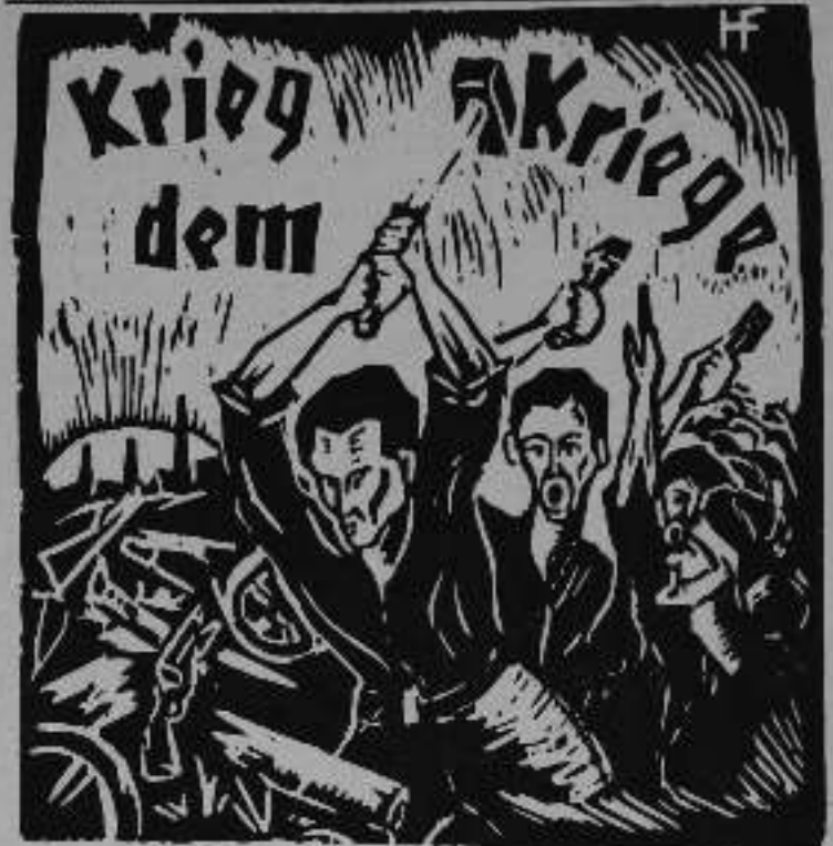
"ΝΕΟΙ ΑΝΑΡΧΙΚΟΙ", όργανο της συνδικαλιστικής αναρχικής νεολαίας Γερμανίας.

Ναι. Κοποτε φτάσαμε τον αριθμό των 120000 φύλλων. Ήσαν το πιο ψηλό όριο. Ο μέσος όρος ήταν γύρω στα 100000 φύλλα, τότε στις συγκρούσεις της Ρουρκεμπιλτ (1923/24). Οι συνδικαλιστές βρισκόταν τότε στη πρώτη γραμμή. Στο Ντεσσελντορφ βγαζόσε μια καθημερινή εφημερίδα την "Δημοκρατία". Για δύο περίπου χρόνια κυκλοφορούσε καθημερινά. Το κειολό θέμα που μας απασχολούσε τότε ήταν το ζήτημα της ανεργίας και η συμβουλευτική οργάνωση. Υποστήριξαμε τον σχηματισμό εργοστασιακών συμβουλίων -αλλά σκεκαί τον μετεπειτα νόμο για την λείπτου εργά-τους, που ίσχυε μόνο για τα μεγάλα εργοστάσια. Σίγουρα παίξαμε έναν πολύ συγκεκριμένο ρόλο, αλλά ο κυρίος σγκος των εργατών ήταν οργανωμένος στο ADGB[8].