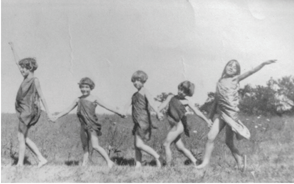
Ο χορός συνεχιζόταν ανέμελα και μετά το σχολείο (φωτ. του 1924-25)