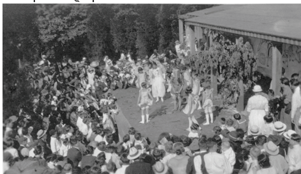
Θεατρική παράσταση για φίλους και συγγενείς το 1915

ταποθήκη που είχε μετατραπεί σε οικοτροφείο, ενώ παραδίπλα είχε χτιστεί ένας υπαίθριος κοιτώνας, που στέγαζε τριάντα παιδιά που είχαν μεταφερθεί από την πόλη. Όμως, οι συνθήκες διαβίωσης ήταν εξαιρετικά δύσκολες, καθώς τα οικονομικά προβλήματα ήταν πολλά και οι εγκαταστάσεις δεν είχαν ακόμη ολοκληρωθεί. Δυστυχώς, ήταν εκείνη την περίοδο που η κόρη της Margaret Sanger, Peggy, έπαθε πνευμονία και πέθανε σε νοσοκομείο στη Ν. Υόρκη.