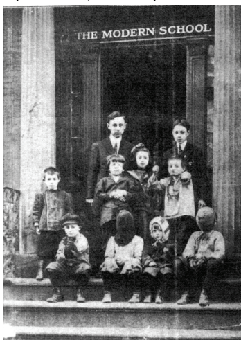
Το «Κέντρο Ferrer»