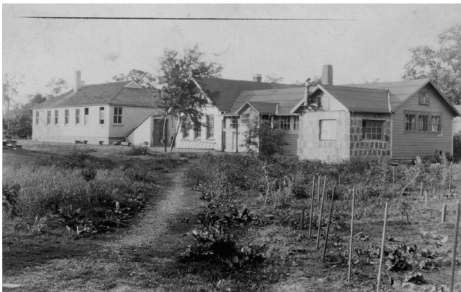
Οι σχολικές εγκαταστάσεις και τα εργαστήρια ολοκληρωμένα

Οι μαθητές, όπως επίσης και οι γονείς, συμμετείχαν στη διοίκηση του σχολείου, το οποίο αποτελούσε το στολίδι της κοινότητας, το κέντρο ενδιαφέροντος της ζωής της και τον κύριο λόγο ύπαρξής της. Η κοινότητα συγκέντρωνε μετανάστες και ντόπιους, διανοούμενους και εργάτες στον ίδιο βαθμό, ενώ δεν δίνονταν καμία σημασία στην καταγωγή και την προέλευση του καθενός. Επίσης, όλοι ήταν ιδιαίτερα προσεκτικοί όσον αφορά τις ελευθερίες των μελών στο ζήτημα της σεξουαλικής και φυλετικής ισότητας. Έτσι, πολλά ζευγάρια συζούσαν χωρίς να έχει προηγηθεί γάμος και τα παιδιά τα φρόντιζαν από κοινού.