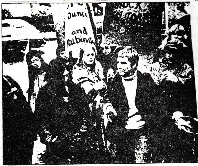
Διαδήλωση της NAPA (Network Against Psychiatric Assault) στην Καλιφόρνια έναντι ηλεκτροσόκ (από τό Madness Network News, 1975).

Σαν εμπνευστές των απαραδεκτών μεθοδεύσεων σε βάρος του προσωπικού, το Διοικητικό Συμβούλιο του Σωματίου Εργαζομένων ΚΑΤΑΓΓΕΛΛΕΙ τους εργοδότες, κ' σαν εκτελεστές υπαλλήλους-όργανα της εργοδοσίας".