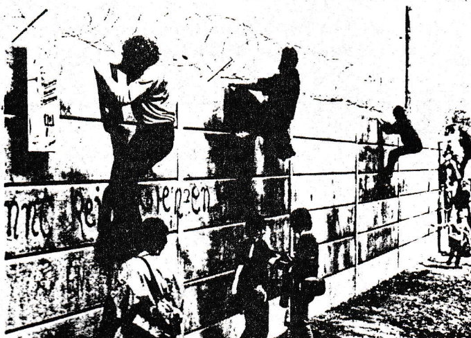
Auf der Mauer auf der Lauer

Με το σύνθημα: "Μιά ειρηνική διαδήλωση χρειάζεται κι ένα κίνημα μέσα στη αστυνομία" εισβάλλανε οι φύλακες της τάξης στα μέσα μαζικής ενημέρωσης της Ρηνανίας. Οι δημοσιογράφοι επισήμαναν αμέσως μιά καινούργια "επίσημη γραμμή" στην αστυνομία. Το Χάσελμπαχ αναγνωρίστηκε έτσι σαν "ευκαιρία για έρευνα πάνω στο θέμα της ειρηνικής συνύπαρξης διαδηλωτών-αστυνομικών."