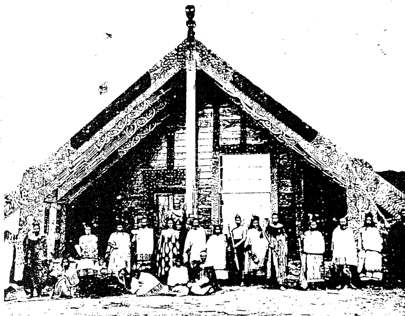
Μαορι: μεγάλο σπίτι συναθροίσεων, χτισμένο στα τέλη του 19ου αιώνα (Νέα Ζηλανδία).