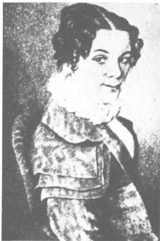
Η μητέρα του Μπακούνιν Βαρβάρα

Πηγές της εξέγερσής του • Επειδή η εξέγερση είναι μία σκληρή θεωρητική αρχή στην οποία έμεινε προσηλωμένη η θεωρία του Μπακούνιν, κάθε ανάλυσής της πρέπει να προηγείται η έρευνα των αιτίων της. Μας ικανοποιεί να διαπιστώνουμε ότι στην πηγή κάθε εξέγερσης υπάρχει μία αρχή ενέργειας και υπερβολικής δραστηριότητας. Είναι το επαναστατημένο άτομο που θ' απελευθερώσει τα πλήθη, τα οποία πιέζονται όλο και περισσότερο. Αυτή είναι και η περίπτωση του Μπακούνιν. Ο Χέρτσεν αποκαλύπτει το βιολογικό βάθος της εξέγερσής του, δεβαιώνοντας ότι στο βάθος της φύσης του ανθρώπου βρίσκεται το σπέρμα μιας κολοσσιαίας αλλά αχρη-