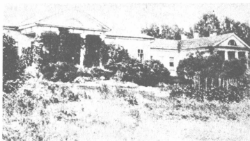
Το σπίτι όπου γεννήθηκε ο Μ. Μπακούνιν

κού του χαρακτήρα παραμελεί και δικαιώματα και καθήκοντα. Ο Μπακούνιν πιστεύει ότι εκεί θ' ανακαλύψει τη δικαίωση ενός συναισθηματικού ξεσπάσματος, μιας ερωτικής έξαρσης, ενός αίματος που κοχλάζει από αόριστους πόθους που αισθάνεται συγκεχυμένα εντός του. Κυρίως τον ελκύει η ρομαντική άλως του λόγου του Φίχτε. Μόλις αυτή διαλυθεί ο Μπακούνιν γρήγορα θ' απομακρυνθεί απ' αυτόν. Η περίοδος της επιρροής του Φίχτε θα παραμείνει χωρίς επαύριο.