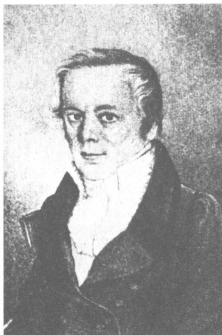
Ο πατέρας του Μπακούιν Αλέξανδρος

θερά ανυψωθεί και κατά κάποιο τρόπο πήρε ζωή μ' ένα είδος εκρηκτικής δύναμης. Αρκεί να συλλάβουμε την ουσία της, έστω κι αν αποτελείται από αντιθέσεις, ενοχές και ασυμφωνίες, αλλά επίσης και λαμπρούς εκπληκτικούς οραματισμούς, για να πεισθούμε ότι διατηρεί μία ασύγκριτη γονιμότητα. Πνεύμα απλό, άτακτο, κυριευμένο από πάθη συχνά ανομολόγητα, αλλά προικισμένο με τα μεγάλα δώρα της αντίληψης, ο Μπακούιν ξέρει ν' αναγνωρίζει σ' ένα σπάνιο βαθμό τις σταθερές ροπές των δυνάμεων που κυριαρχούν στην κοινωνική ζωή. Ο Μαξ μάταια τον περιφρονούσε χαρακτηρίζοντάς τον σαν έναν από τους πιο ανίδεους ανθρώπους στον τομέα της κοινωνικής θεωρίας. Αναμφίβολα είναι ερασιτέχνης, αλλά για τούτο ακριβώς είναι επίσης ένας θαυμάσιος παρατηρητής της κοινωνικής πραγματικότητας. Γι' αυτό, αντιμετωπίζοντας το σύγχρονο Λεβιάθαν , του οποίου προέβλεψε όλες τις φρικαλεότητες, προβάλλαμε τη σκιά των προ-