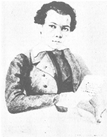
Μ Μπακούνιν, Ακουαρέλλα, 1838

ποίηση γεμάτη σκλάβους, είμαστε υποχρεωμένοι ν' αναγνωρίσουμε πως μέσα σ' αυτή τη συνεχιζόμενη εναλλαγή της αλλοτρίωσης και της κατάργησης της αλλοτρίωσης, της καταπίεσης και της απελευθέρωσης, η επανάσταση αποτελεί μια αιώνια και σχεδόν απόλυτη αξία, ότι, όπως θα λεχθεί για τις μέρες μας από το Ζαν-Πωλ Σαρτρ στην Κριτική του διαλεκτικού λόγου , αυτή είναι «η έναρξη της ανθρωπότητας».