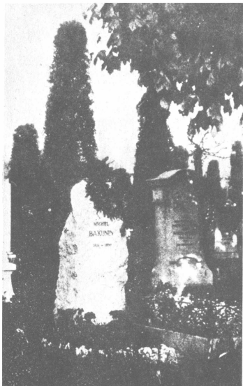
Ο τάφος του Μ. Μπακούιν στη Βέγη