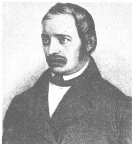
Α. Ρούγκε, 1848

το 1841, γράφει: «Στην εσωτερική μας ανάπτυξη, σημαντικό ρόλο παίζουν ο φόβος της επανάστασης και ο φόβος για την ελευθερία. Τα μισητά συστήματα της αναμόρφωσης και της αντίδρασης, αντιμετωπίζονται με δειλία και δισταγμό, με υποκρισία και συμβιβασμούς. Οι στενόμυαλοι επικρατούν και κανείς δεν θέλει να πάρει μια ακραία θέση. Αλλά αυτό δεν θα μείνει έτσι».