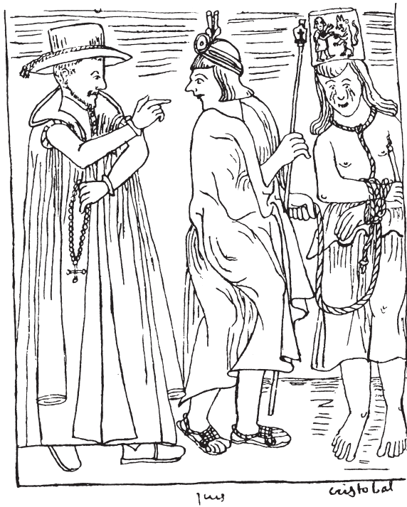
Δημόσια διαπόμπευση γυναικών των Άνδεων στη διάρκεια μιας εκστρατείας κατά της ειδωλολατρίας. Αρχές 17ου αιώνα.