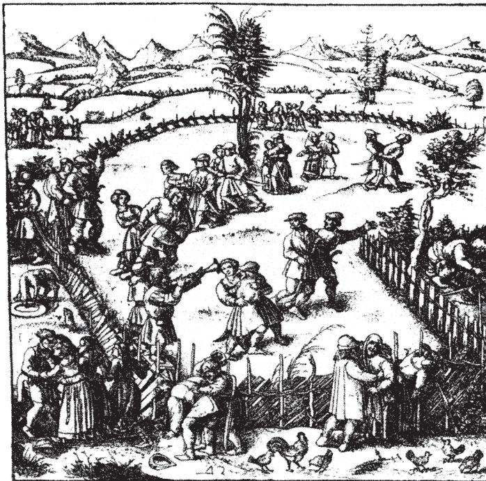
Όλες οι γιορτές, τα παιχνίδια και οι συγκεντρώσεις των αγροτικών κοινοτήτων πραγματοποιούνταν στις κοινές γαίες. Χαρακτικό του 16ου αιώνα.