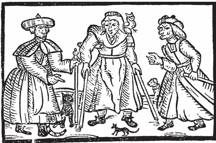
Κλασική απεικόνιση της μάγισσας. Περιστοιχίζεται από τα ζώα της και τις φίλες της, και παρ' όλο που είναι γριά και υπό κατάρρευση διατηρεί μια στάση ανυπακοής. Αγγλία, αρχές 17ου αιώνα.