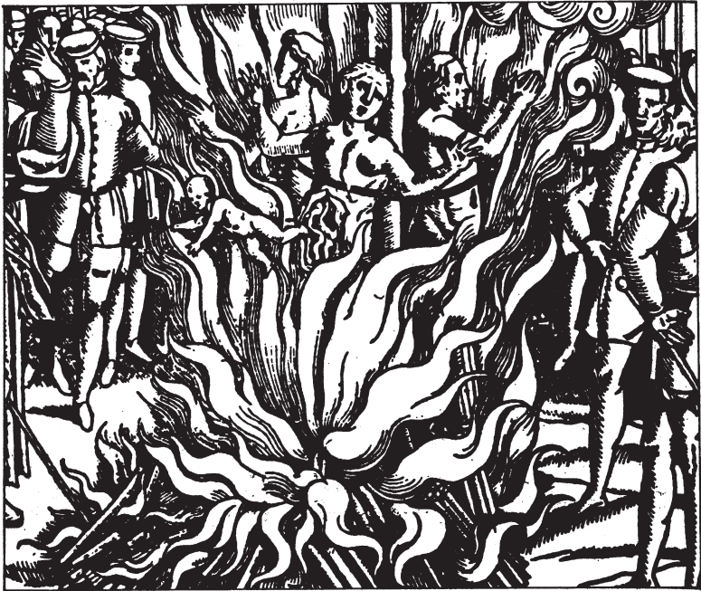
Τρεις γυναίκες καίγονται ζωντανές στην αγορά του Γκέρνσεϊ. Χαρακτικό ανωνύμου, Αγγλία, 16ος αιώνας.