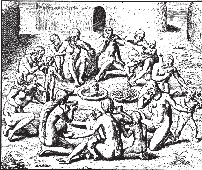
Συμπόσιο κανιβάλων στην Μπαχία της Βραζιλίας. Οι απεικονίσεις αυτού του είδους αφθονούσαν σε ταξιδιωτικά ημερολόγια Ευρωπαίων την εποχή μετά την Κατάκτηση.