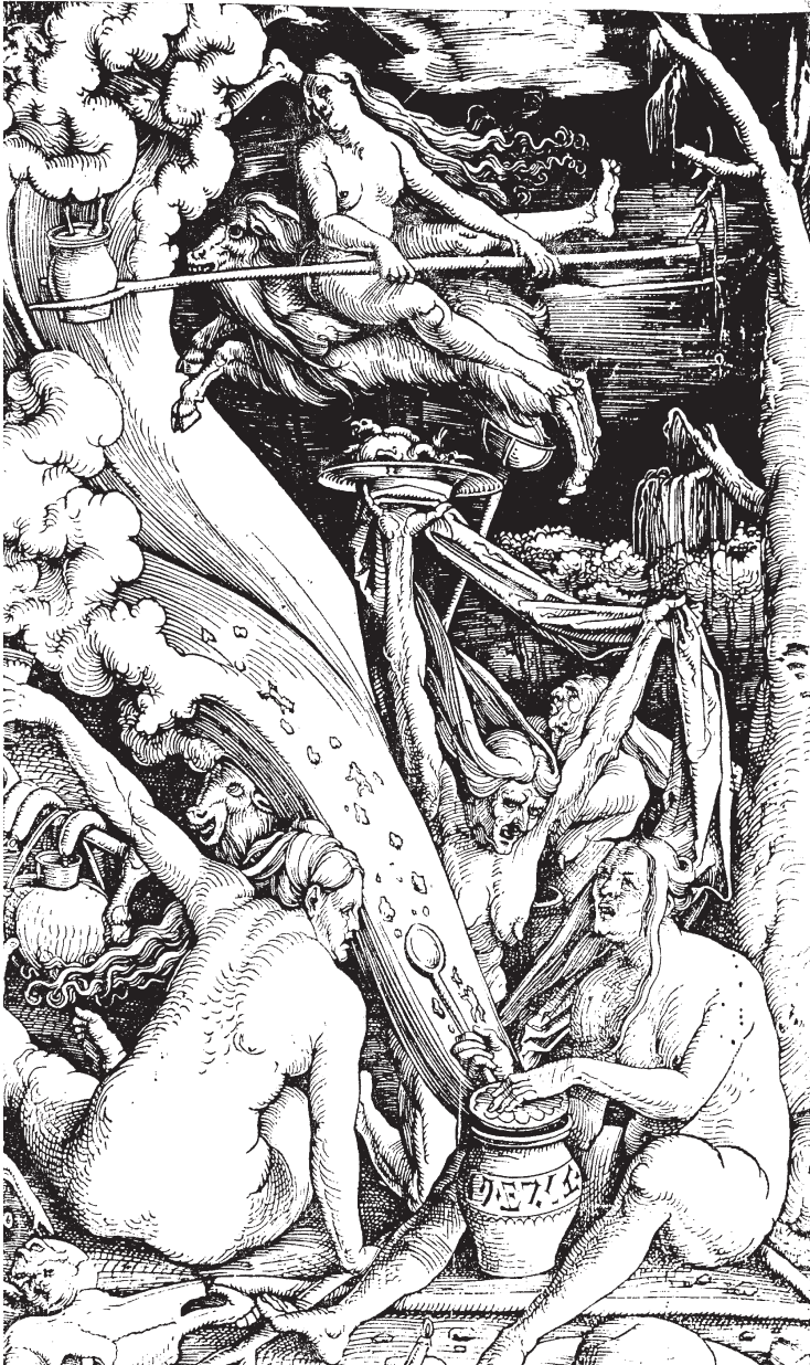
«Το Σαμπάτ των Μαγισσών» (1510). Το πρώτο και πιο διάσημο μιας σειράς χαρακτηριστικών του γερμανού καλλιτέχνη Hans Baldung Grien, που, με το πρόσημα της καταγγελίας, χρησιμοποιεί πορνογραφικά το γυναικείο σώμα.