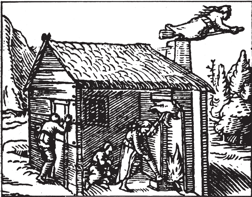
Γυναίκες που αλείφουν στο σώμα τους μαγικές πομάδες και πετούν με τις σκούπες τους προς το Σαμπάτ. Γαλλία, χαρακτηριστικό του 16ου αιώνα.