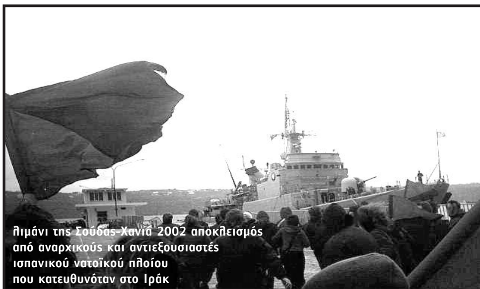
Πιμάνι της Σούδας-Χανιά 2002 αποκλεισμός από αναρχικούς και αντιεξουσιαστές ισπανικού νατοϊκού πλοίου που κατευθυνόταν στο Ιράκ

απτή πραγματικότητα ρήξης και σύγκρουσης απέναντι στον πολιτισμό της εξουσίας.